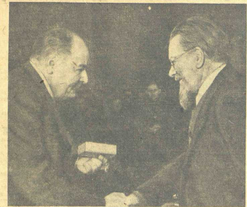
М. И. Калинин вручает орден Ленина заместителю Председателя Президиума Верховного Совета СССР А. Е. Бадаеву.